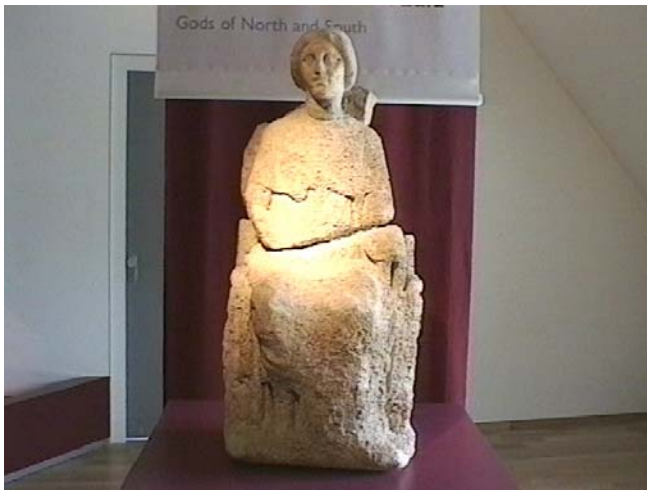
De godin Nehallenia

Onderwerp: Zoeken naar de overblijfselen van de verdronken tempel geweid aan de godin Nehallenia beschermvrouwe der zeelieden in de Romeinse tijd alsook naar de nederzetting en de haven.