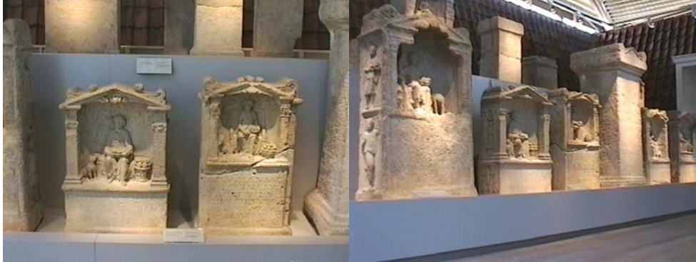
Altaren opgevist door Kees Bout in 1970