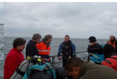
R v Dierendonck